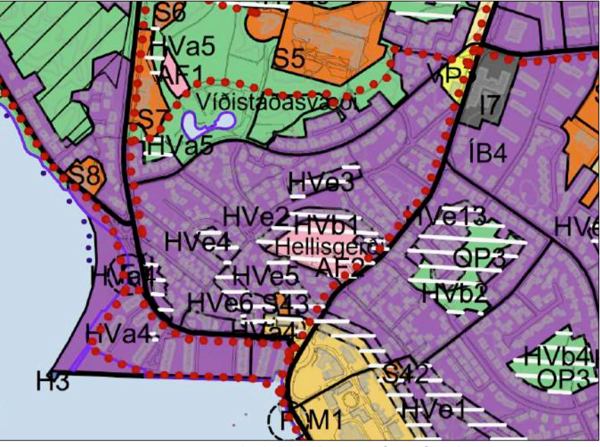
Ábalskipulag Hafnarfjarðar 2013-2025